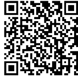
模具预热操作 (适配温敏材料)